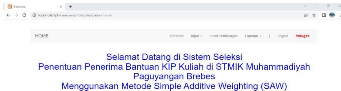
Gambar 2 Halaman Utama

Pada tampilan menu utama terdapat beberapa menu yaitu menu beranda, menu input, menu hasil perhitungan, dan menu laporan. Didalam menu input terdapat submenu yaitu menu, input data mahasiswa, menu data kriteria, menu data bobot, dan menu data persyaratan mahasiswa.